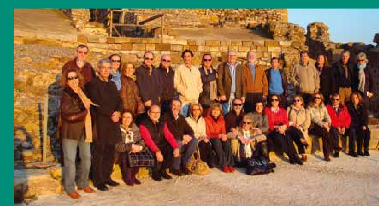
Fin Del Congreso