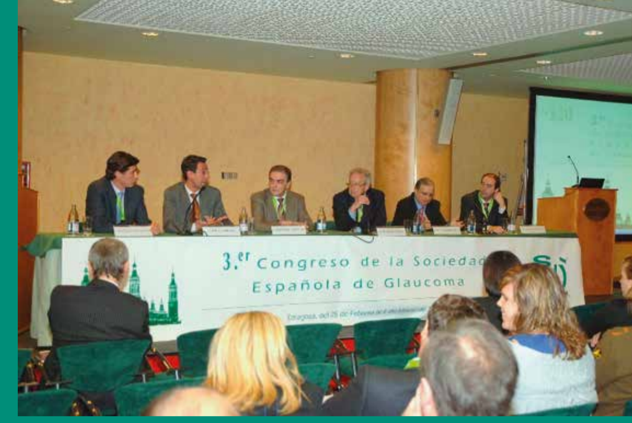
Simposio Highlights en glaucoma