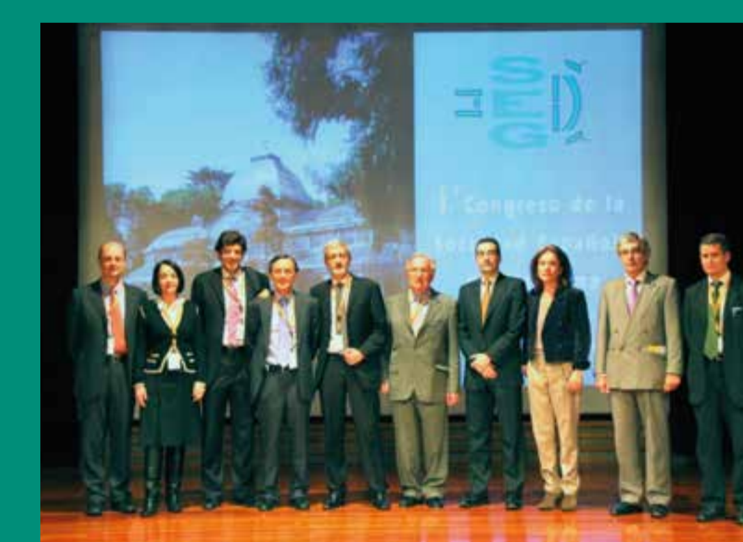
Junta entrante y saliente