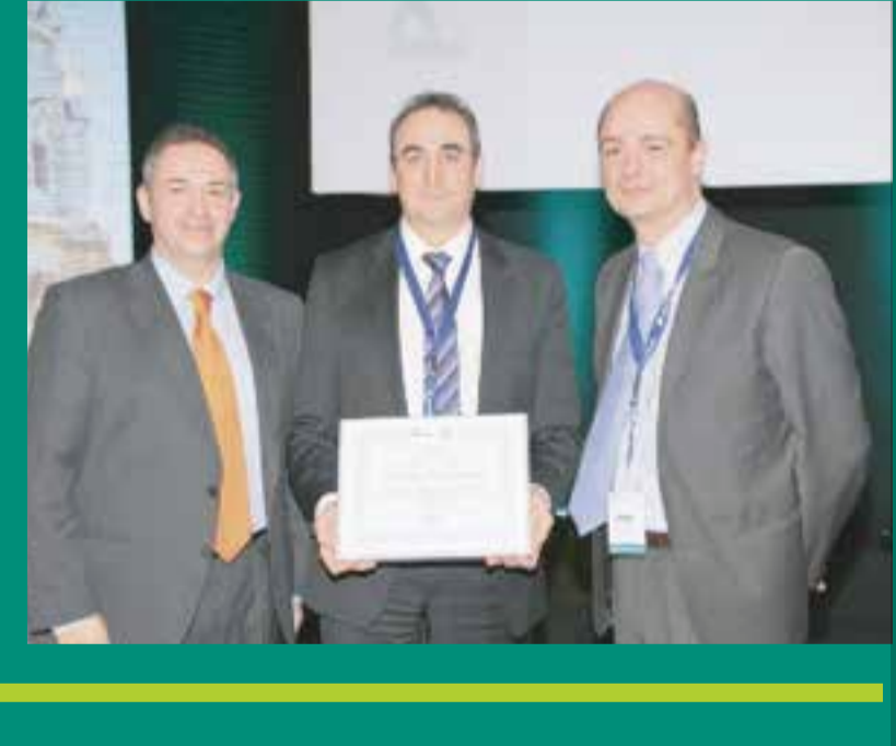
PREMIOS THEA SEG