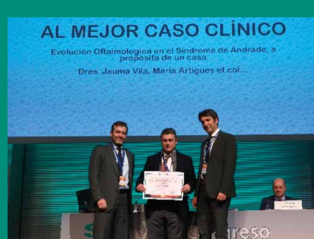
PREMIO HORUS-MEJOR CASO CLÍNICO Por primera vez se entregan los premios HORUS al mejor caso clínico