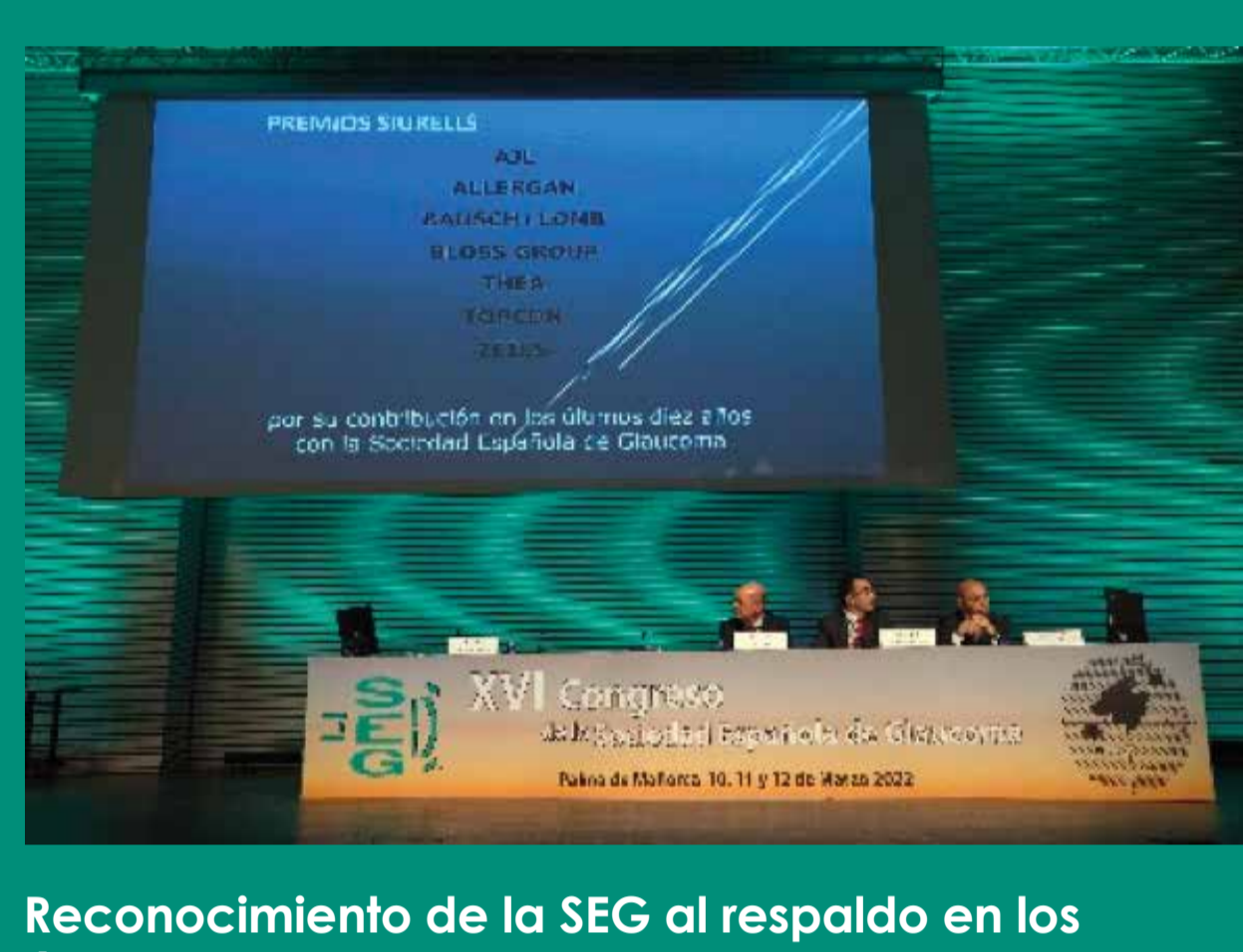
Reconocimiento de la SEG al respaldo en los últimos 10 años de los laboratorios, AJL, ALLERGAN, BAUSCH+LOMB, BLOSS, THEA TOPCON Y ZEISS