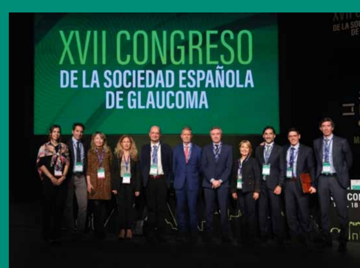
Junta saliente y entrante Madrid 2023