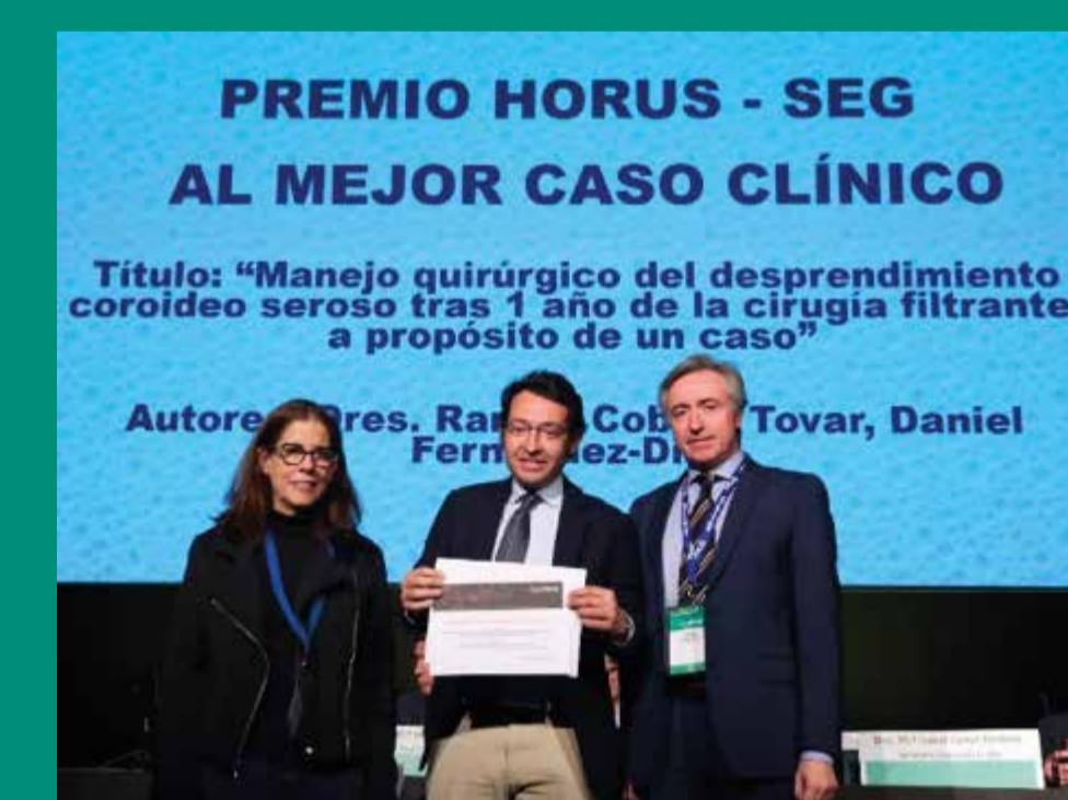
PREMIO HORUS-Mejor caso clínico