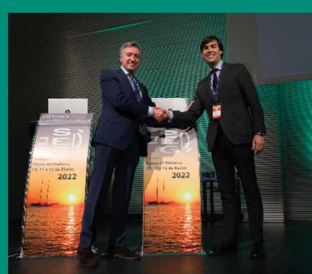
PREMIO COMUNICACIÓN ORAL