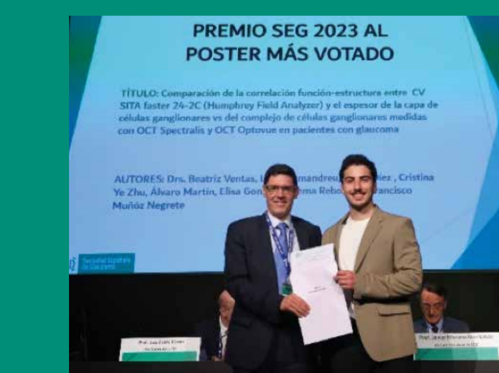
Premio poster más votado