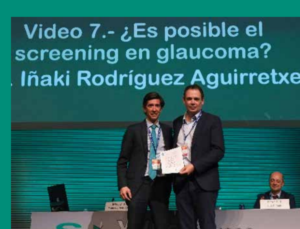
PREMIO SEGUNDOS EN GLAUCOMA