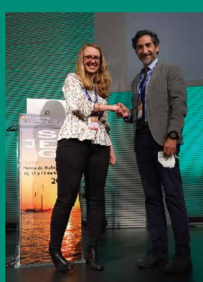
PREMIO COMUNICACIÓN EN PANEL