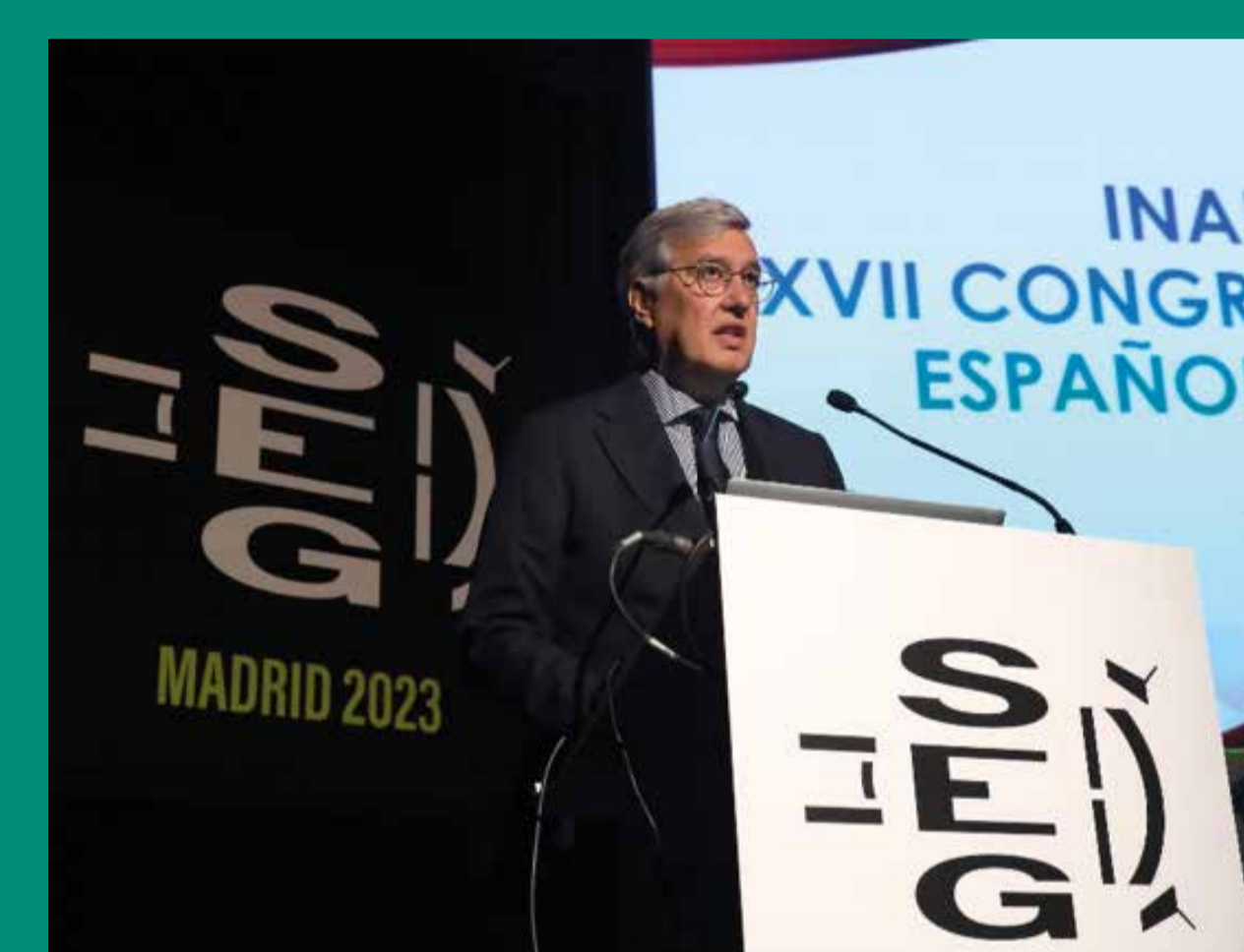
Inaugura el congreso, el periodista Ernesto Soeñz de Buruaga